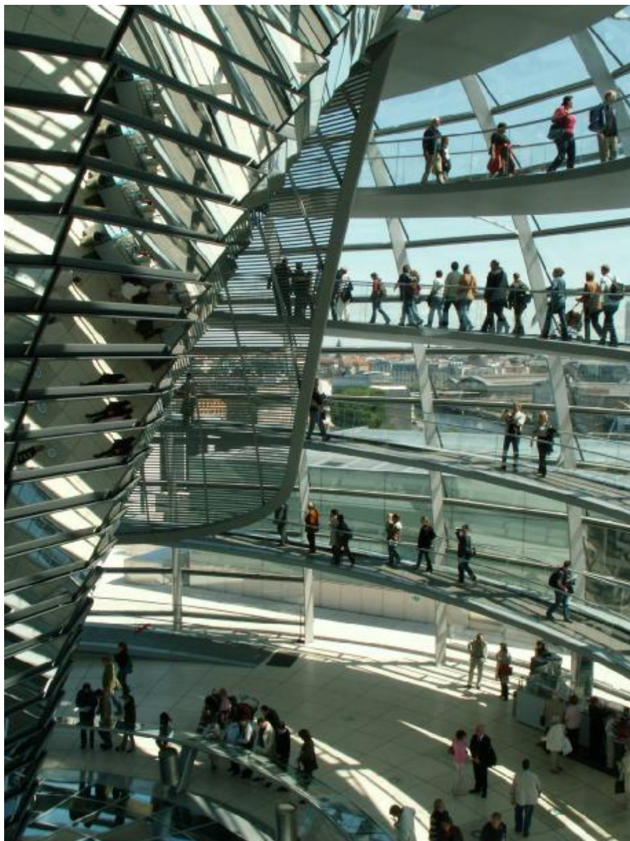
(Berlin Maj 2007 – Kaj)

Demokrati med "udsyn" på toppen af Rigsdagen i Berlin